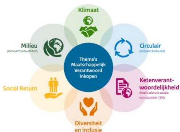
Figuur 2. Zes thema's voor Maatschappelijk Verantwoord Inkopen.

Social return is een instrument dat door overheden kan worden ingezet bij inkopen om de arbeidsparticipatie van mensen met een afstand tot de arbeidsmarkt te stimuleren. Social return maakt onderdeel uit van een van de zes (landelijke) thema's voor Maatschappelijk Verantwoord Inkopen (zie figuur 2). Cijfers van 2019 laten zien dat social return in 71% van de (gemeten) inkopen wordt meegenomen. 6